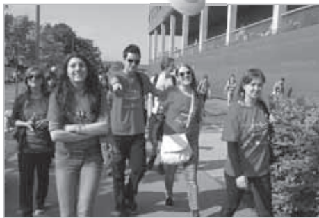
Kirchentag in Dresden. Die Jugendlichen aus Rumänien tragen T-Shirts mit Kirchenburgen-Motiv