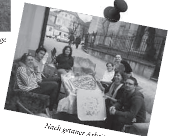
Nach getaner Arbeit...