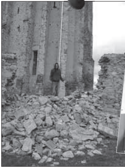
Seligstadt. Gott sei Dank waren nicht wir's