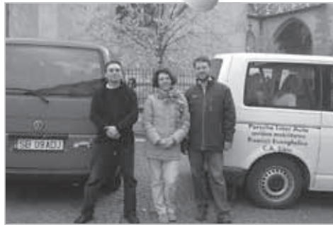
Eine gelungene Zusammenarbeit Kirche-Forum beim Seminar für Erlebnispädagogik in Michelsberg