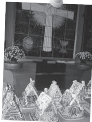
Im Gemeindehaus Hipodrom werden jedes Jahr Lebkuchenhäuschen für den Adventbasar hergestellt