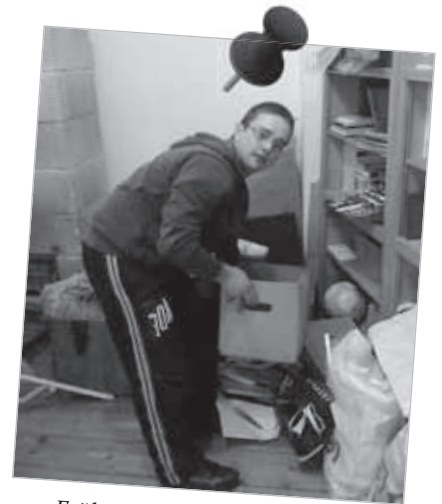
Frühjahrsputz in der Teestube