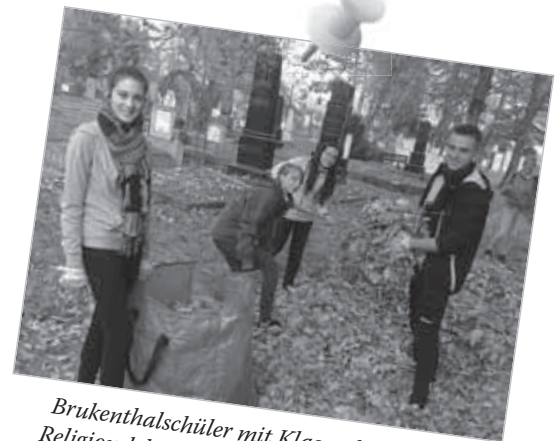
Brukenthalschüler mit Klassenlehrer und Religionslehrer beim Säubern des Friedhofs