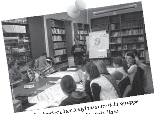
Studientag einer Religionsunterricht sgruppe im Friedrich-Teutsch-Haus