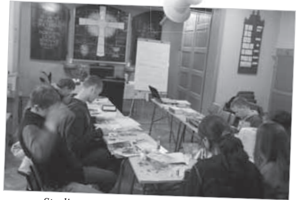
Studientag im Gemeindehaus Hipodrom.