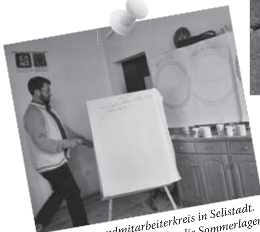
Landesjugendmitarbeiterkreis in Selistadt. Intensive Vorbereitungen für die Sommerlager - Olympiade ist angesagt