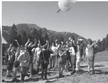
Große Jugendreise. Jugendliche aus Hermannstadt, Osnabrück und Prag beim Wandern im Allgäu