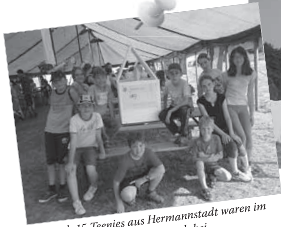
Auch 15 Teenies aus Hermannstadt waren im Jungcharlager dabei