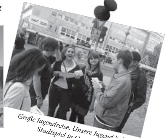
Große Jugendreise. Unsere Jugend beim Stadtspiel in Osnabrück