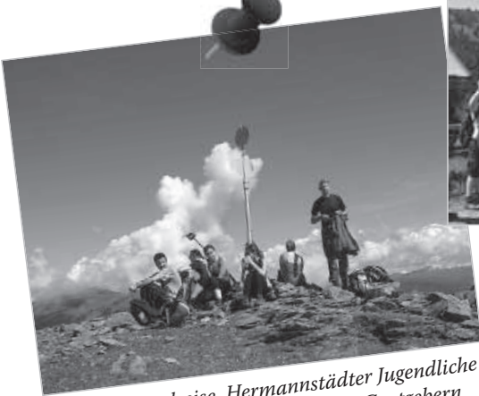
Große Jugendreise. Hermannstädter Jugendliche in den Kärntner Bergen mit den Gastgebern aus Klagenfurt