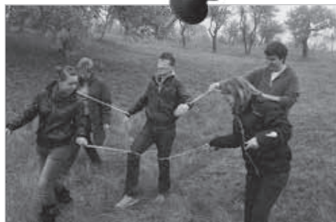
Vertrauern und Teamarbeit sind wichtige Ziele der Erlebnispädagogik