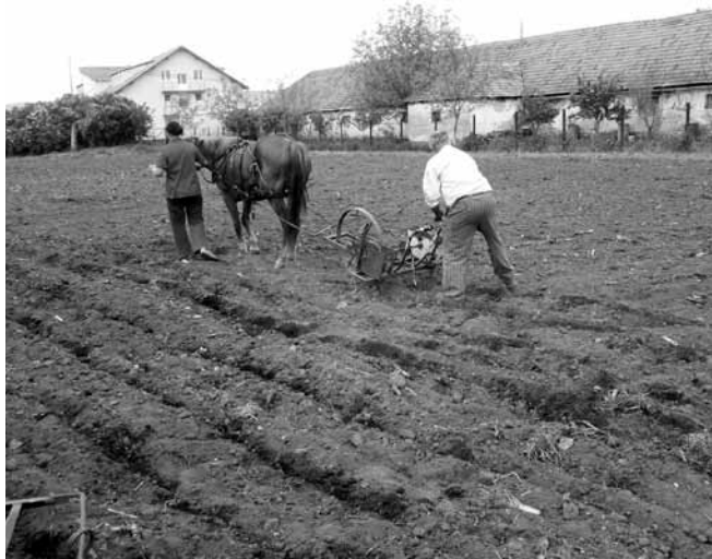
Furchen ziehen fürs Kartoffelsetzen im Schellenberger Garten

Zur Selbstversorgung sowie zum Verkauf ist auf dem Gelände in Schellenberg außerdem Vieh und es wird Landwirtschaft auf dem kircheneigenen Land betrieben. Beides wird momentan vor allem noch von Mitarbeitern der Kirche verwaltet. Nach und nach soll dies aber von den Bewohnern übernommen werden. Neben Hühnern, Hasen sowie Schafen sei ein Pferd die nächste Anschaffung, dies könne zur Landwirtschaft eingesetzt werden. Landwirtschaft sowie Viehzucht werden nach biologischen Maßstäben durchgeführt, denn das Projekt soll als Biolandwirtschaft zertifiziert werden. Momentan leben zwei Familien in Schellenberg.