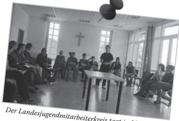
Der Landesjugendmitarbeiterkreis tagt in Michelsberg