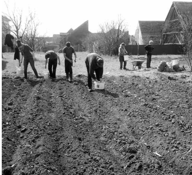
Der Mais wird ausgesät

Die Wohnungen auf dem Gelände werden Menschen mit Behinderung und Obdachlosen ebenso wie Menschen mit hoher finanzieller Belastung bereitgestellt. Den Menschen in den kirchlichen Wohnungen soll Hilfe zur Selbsthilfe gegeben werden. „Sie bekommen eine Möglichkeit durchzuatmen, um sich dann in einem geregelten Alltag Schritt für Schritt wieder etwas Neues zu erarbeiten“, so die Diakoniebeauftragte. Dabei gäben die Mitarbeiter der Kirche Hilfestellung bei Arbeitsplatz- Wohnungssuche oder dem Stellen von Anträgen beispielsweise zur Rente. Vordergrundig müssten die Bewohner des Projektes ihr Weiterkommen aber selbst in die Hand nehmen. „Sie sollen sich wieder in die Gesellschaft integrieren können“, so Fakazaş. Das Leben im Projekt in Schellenberg ist als Durchgangsstation gedacht.