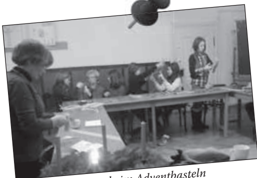
Teenies beim Adventbasteln