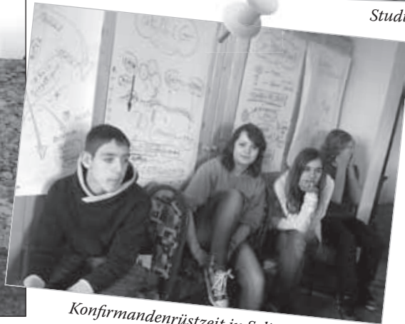
Konfirmandenrüstzeit in Seligstadt