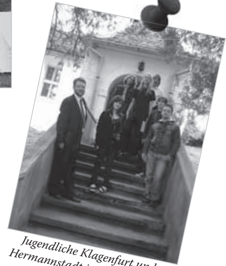
Jugendliche Klagenfurt und Hermannstadt im Gottesdienst in Burgberg