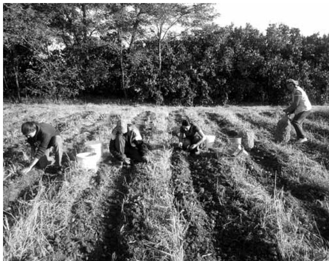
Die erste Kartoffel-Ernte im Schellenberger Garten