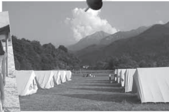
Das Zeltlager bei Rosenau